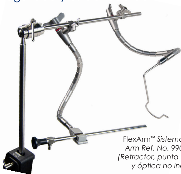
FlexArm™ Sistema Plus Twin Arm Ref. No. 99055-QCLR (Retractor, punta de sujeción y óptica no incluidos)

Especialmente diseñado con ajuste de poste hexagonal para la fijación directa a los sistemas de sujeción y posicionamiento Mediflex®, para una máxima seguridad y estabilidad de retracción