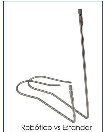
Robótico vs Estandar

que ofrece Retradores Nathanson robóticos - diseñados para eliminar la interferencia del brazo durante los procedimientos robóticos